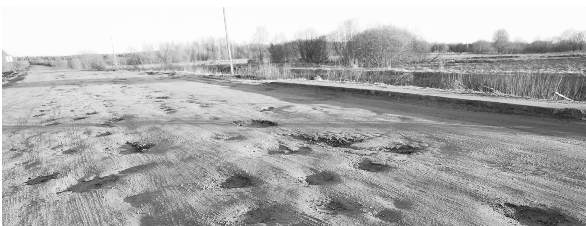
ДОРОГА НА ВАРЕГОВО: ДО И ПОСЛЕ